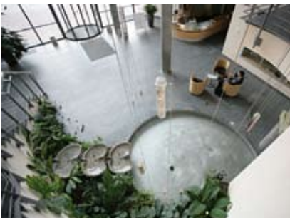
Il Foyer dell'edificio principale di WALA