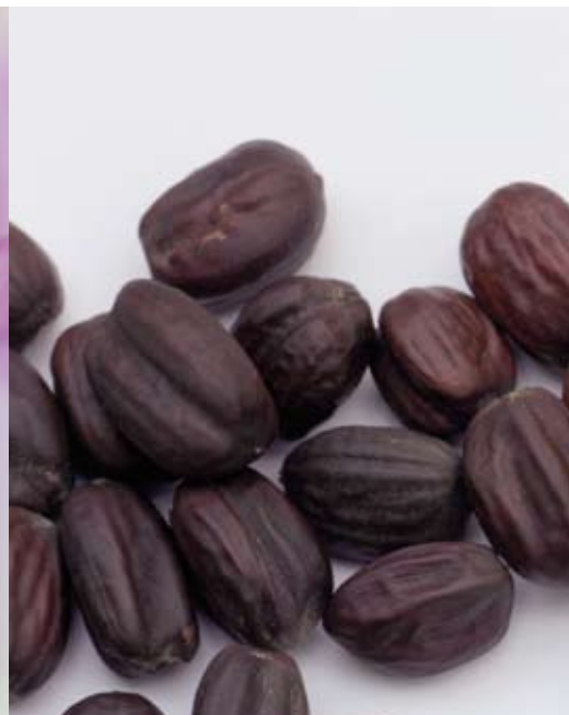
In alto: nello Stato del Burkina Faso, circa 350 donne provenienti da due diversi villaggi si sono riunite in una comunità produttiva che raccoglie e vende le noci di karité. Queste donne si sono date il nome di „IKEUFA“ (Faire bien et meilleur de Diarabakoko), che ha il significato seguente: Fare bene e meglio a Diarabakoko. Sinistra: il comitato direttivo di IKEUFA. Destra: Noci di karité sminuzzate. Al centro: l'olio essenziale di Rosa Damascena (sinistra), le noci di jojoba e l'olio di mandorla (destra) sono solo alcuni degli ingredienti naturali utilizzati nella Cosmesi Dr.Hauschka