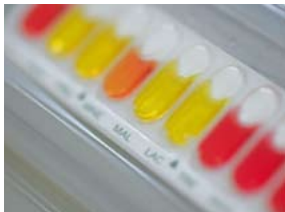
Destra: le analisi microbiologiche appartengono al repertorio standard del laboratorio analitico di controllo interno all'azienda

Ma non è tutto. Durante la produzione, i collaboratori verificano costantemente tutti i parametri cruciali, come il valore ph e la consistenza. Oltre a ciò, gli addetti del controllo qualità prelevano quotidianamente i campioni di ogni prodotto finito in tutte le aree produttive dello stabilimento: i globuli velati e le pastiglie, gli additivi dei prodotti detergenti, la sostanza di base dei mascara; tutti devono superare i test microbiologici, sensori e analitici prima di essere commercializzati. Questi controlli accurati corrispondono agli standard produttivi farmaceutici internazionali e in WALA valgono sia per i medicinali sia per la cosmesi e per i preparati WalaVita.